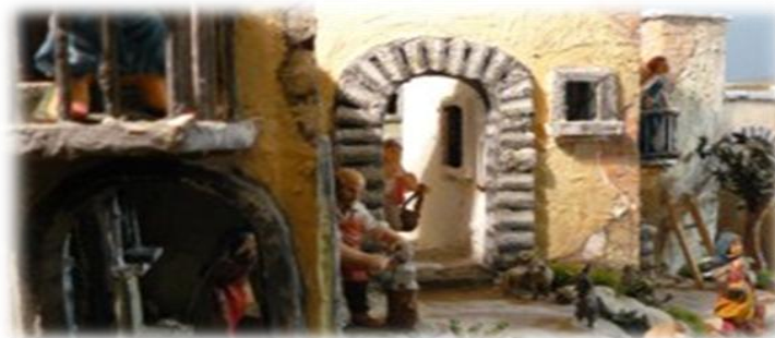
Particolare del Presepe Artistico Permanente di Pietralunga